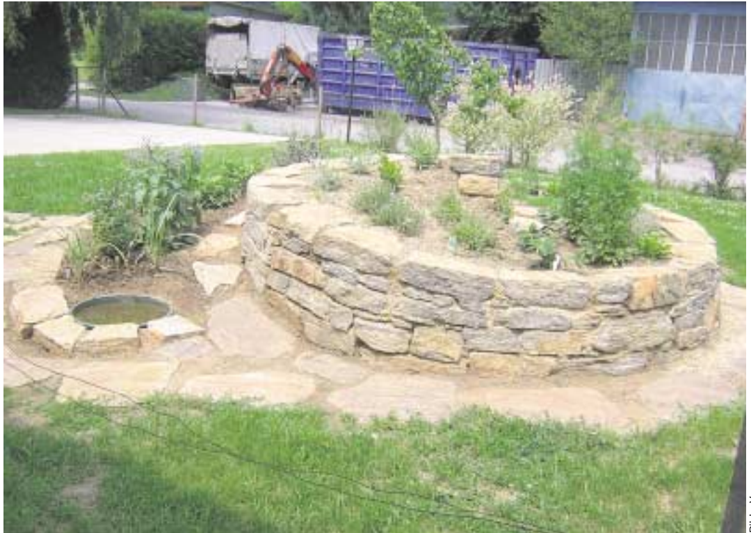
Frisch bepflanzte Kräuterspirale.

■ Was ist eine Kräuterspirale? Eine Kräuterspirale ist eine Kombination aus Steingarten, Trockenmauer, Gartenbeet und Feuchtbiotop, ein schnecken-