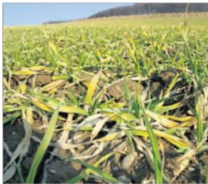
Früh gesäte Wintergerste mit vielen gelben Blättern. Sie ist noch nicht gestartet.

Das Motto für die erste Gabe im Getreide heisst nach wie vor «so früh wie möglich, so wenig wie möglich». 1 bis 2 kg/a Ammonsalpeter ermöglichen den Pflanzen einen guten Start ohne übertriebenes Auswaschungsrisiko. Bei der zweiten Gabe, welche je nachdem schon kurz darauf fällig sein kann, wird abgeschätzt nach Bestandesdichte, Ertragsvermutung, Sorte, Vorfrucht, usw.