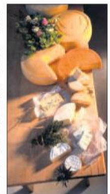
Innovationen im Biokäsemarkt sind gefragt.